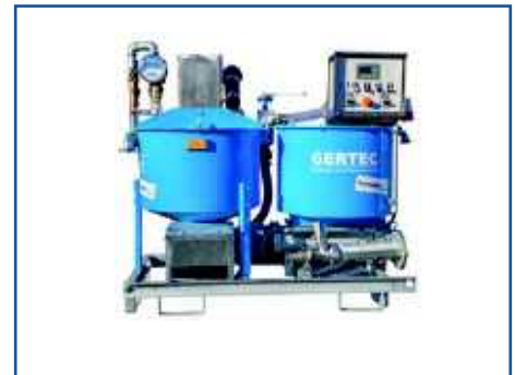
IS-35-E mit diversem Zubehör