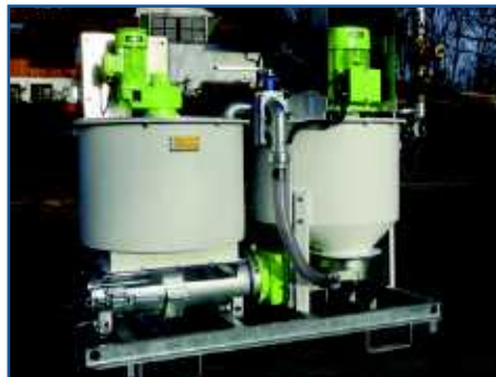
IS-35-E / IS-35-E-light